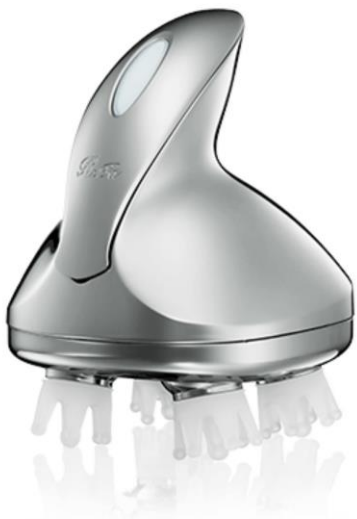
リファグレイスヘッドスパ