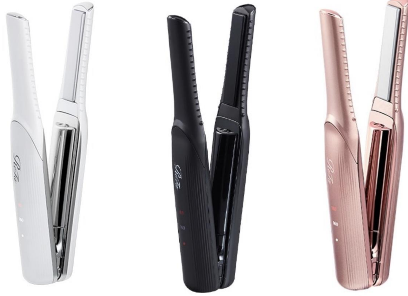
ReFa BEAUTECH FINGER IRON