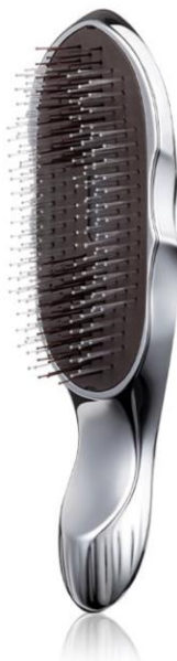
リファイオンケアブラシ