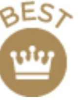
リファモーションカラット