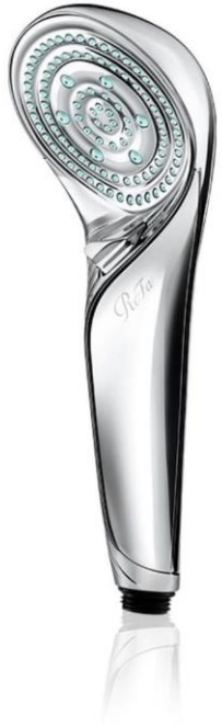
リファファインバブルS